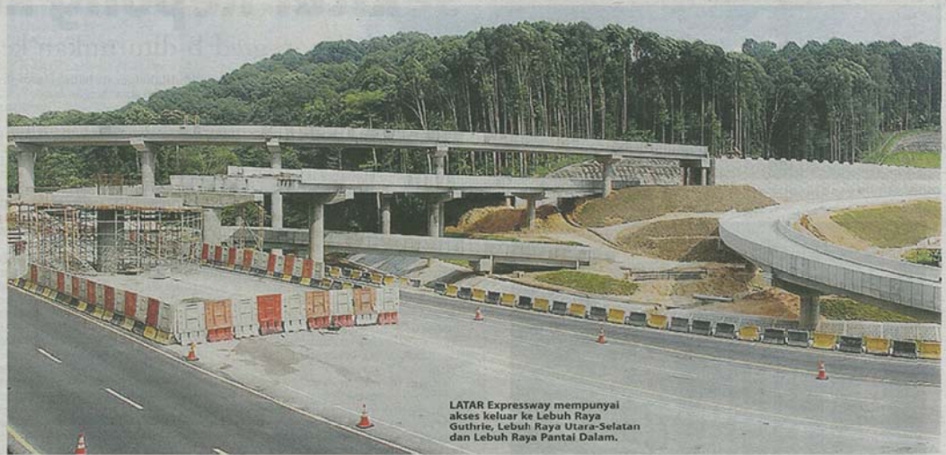
LATAR Expressway mempunyai akses keluar ke Lebuhraya Guthrie, Lebuhraya Utara-Selatan dan Lebuhraya Pantai Dalam.

KONVENSYEN Pengembangan Veterinar dan Mesyuarat Pegawai Perkhidmatan Veterinar Daerah Malakia di Klang, Persekutuan.